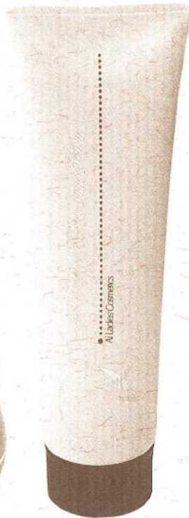
アイレディース・洗顔フォーム 100g ¥3,500 (税込み)