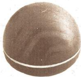
アイレディース・スキンクリームアイエイ 30g ¥20,000 (税込み)